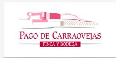
Bodegas Pago de Carraovejas