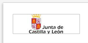
Adm. pública Junta de CYL