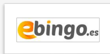
Juego online Grupo Ballesteros